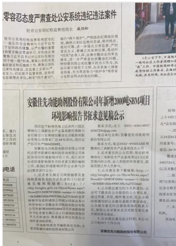
图 4 第一次征求意见稿报纸公示截图