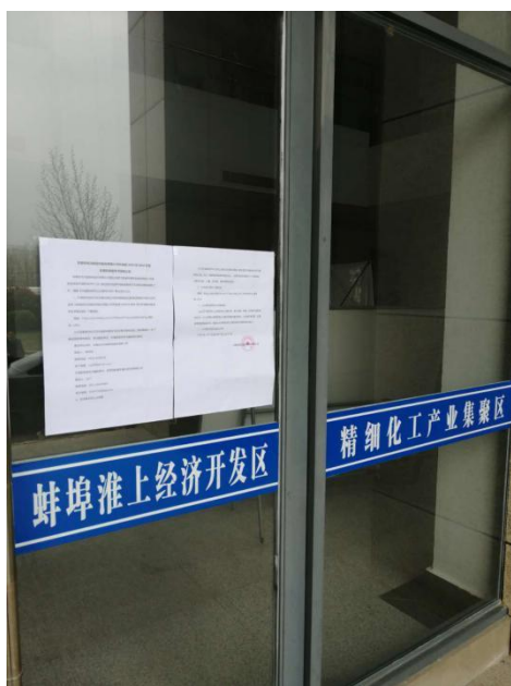
图 6 第一次现场张贴公示