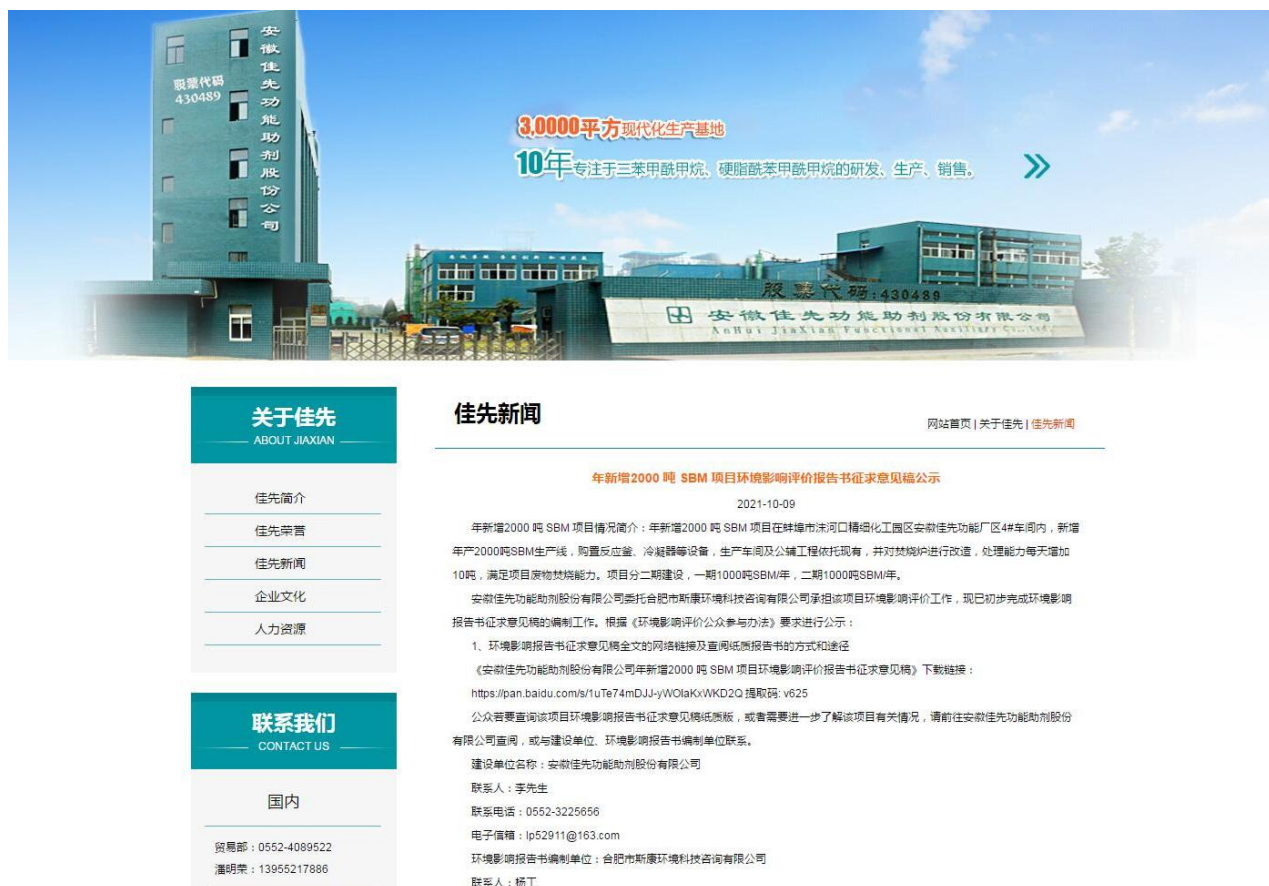
图3 第二次征求意见稿公示网络截图

http://www.jxchem.com.cn/new_cn_detail/id/105.html